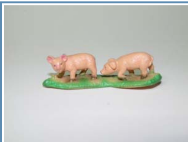
Referência 2213.99.1212 DESIGNAÇÃO LEITÕES C/2