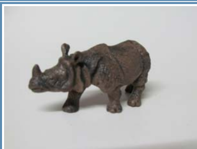
Referência 2213.99.1229 DESIGNAÇÃO RINOCERONTE GRANDE