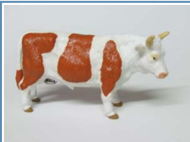
Referência 2213.99.1204 DESIGNAÇÃO BOI GRANDE CASTANHO E BRANCO