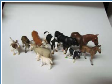
Referência B001606 DESIGNAÇÃO ANIMAIS EM FAMÍLIA C/8