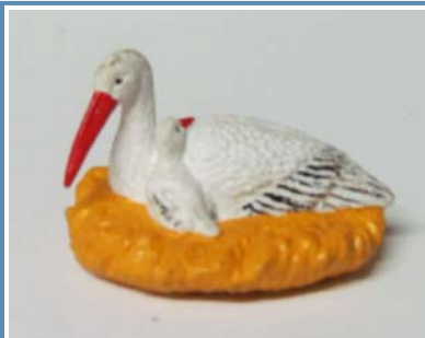
Referência 2213.99.1236 DESIGNAÇÃO CEGONHA C/FILHO